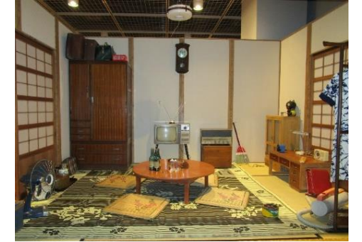
展示風景(イメージ)

博物館では1月2日(土)から2月28日(日)まで、市制123周年記念 企画展「昭和の暮らし 昭和の風景」を開催中です。 令和の時代となり、昭和の時代がまた一歩遠くなりました。私たちの暮らしを大きく変え、現代に通じる多くのものを残した昭和という時代。暮らしの道具を視点にしながら、昭和の四日市の発展を振り返ります。 昭和の道具を見直すことで「心の豊かさや暮らしの便利さとは何か」を問い直し、「いまの暮らし」を見つめなおしてみませんか。