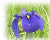
ノハナショウブ （5月頃）