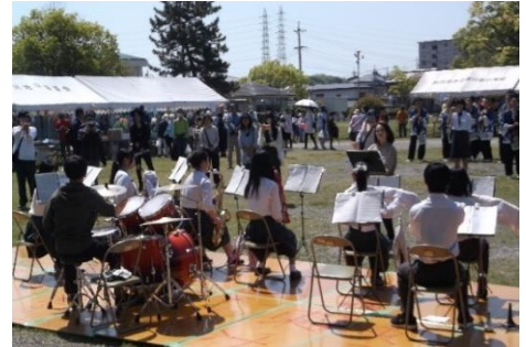
三重県立四日市四郷高等学校 吹奏楽部の みなさんの演奏