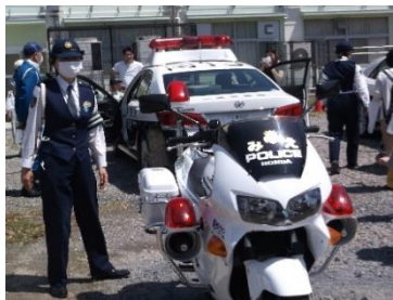
記念撮影会に消防車、白パイ、 パトカーも来場