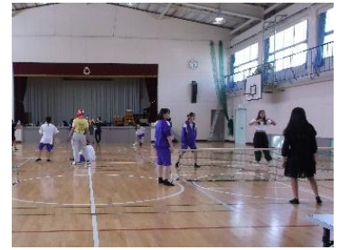
体育館ではタスポニー、ファミリ- バドミントンを楽しんでいました