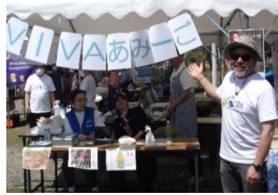
日本語教室「Viva あみーご」も パザー出展