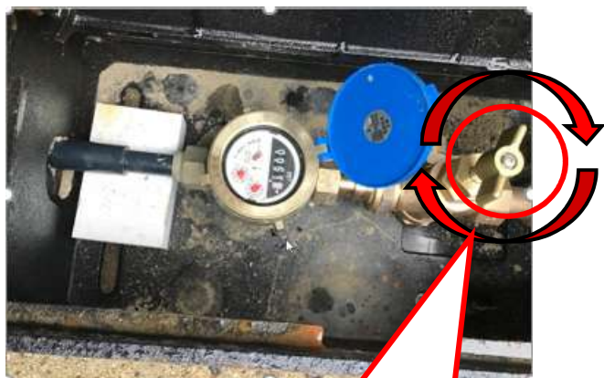
水道管が破損してしまったら

【問合せ先】上下水道局 お客様センター ☎ 354-8355 ホームページ https://www.city.yokkaichi.mie.jp/new_water/